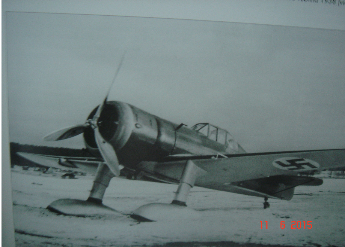
FOKKER D 21

Kurssin jälkeen pilotit jakautuivat eri laivueisiin jatkokoulutettaviksi. Voronpää, Äänislinna, Uomaa, Helyä, Mensuvaara olivat sotakenttiä, joista toimittiin. Isän laivueeksi tuli LeLv 12 ja koneiksi Fokker D21 ja Myrsky-hävittäjä. Tiedustelu -ja torjuntalentoja molemmilla konetyypeillä. LeLv12 varustettuna Myrsky-hävittäjillä ei ollut niitä kaikkein iskukykyisempiä. Sodanjohto harkitsi tarkkaan mihin laivueen Myrskyjä voitiin käyttää. Vihollisella oli jo silloin parempia ja nopeampia koneita. Myrskyjä vaivasi rakenneviat. Korkeusvakaajia oli särkynyt värinäilmiöissä ja koneen valmistusmateriaaleissa oli puutteita. Ulkoilma, pakkanen ja sateet heikensivät ulkona säilytettävien koneiden rakenteita. Potkurin liimasaumat aukeilivat ja muotofaneeri halkeili. Kone ei soveltunut voimakkaaseen jatkuvaan rasiinukseen ilmataisteluissa ja lopulta se poistettiin palveluskäytöstä. Ohjaajien mielestä kone oli erittäin miellyttävä ohjausominaisuuksiltaan. Pulaa oli koneista. Kaikkia oli käytettävä missä vain voi. Lapin sotaan osallistui 7 Myrskyä. Isän viimeisin sotalento 26.10.1944 MY-16:lla Kemistä Lapinsodassa, jossa kahden koneen partiossa havaitsivat sakemännien juuri tuhonneen hotellin Pallastunturilla.